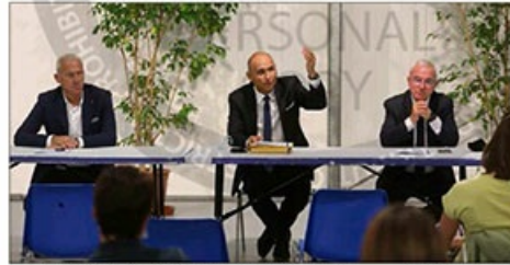
La première grande consultation aura lieu à l'été 2022.