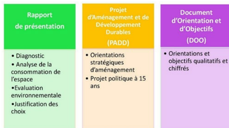
Composition d'un SCOT « SRU »

Le SCOT « SRU » vise l'horizon 15 ans et se compose des pièces suivantes :